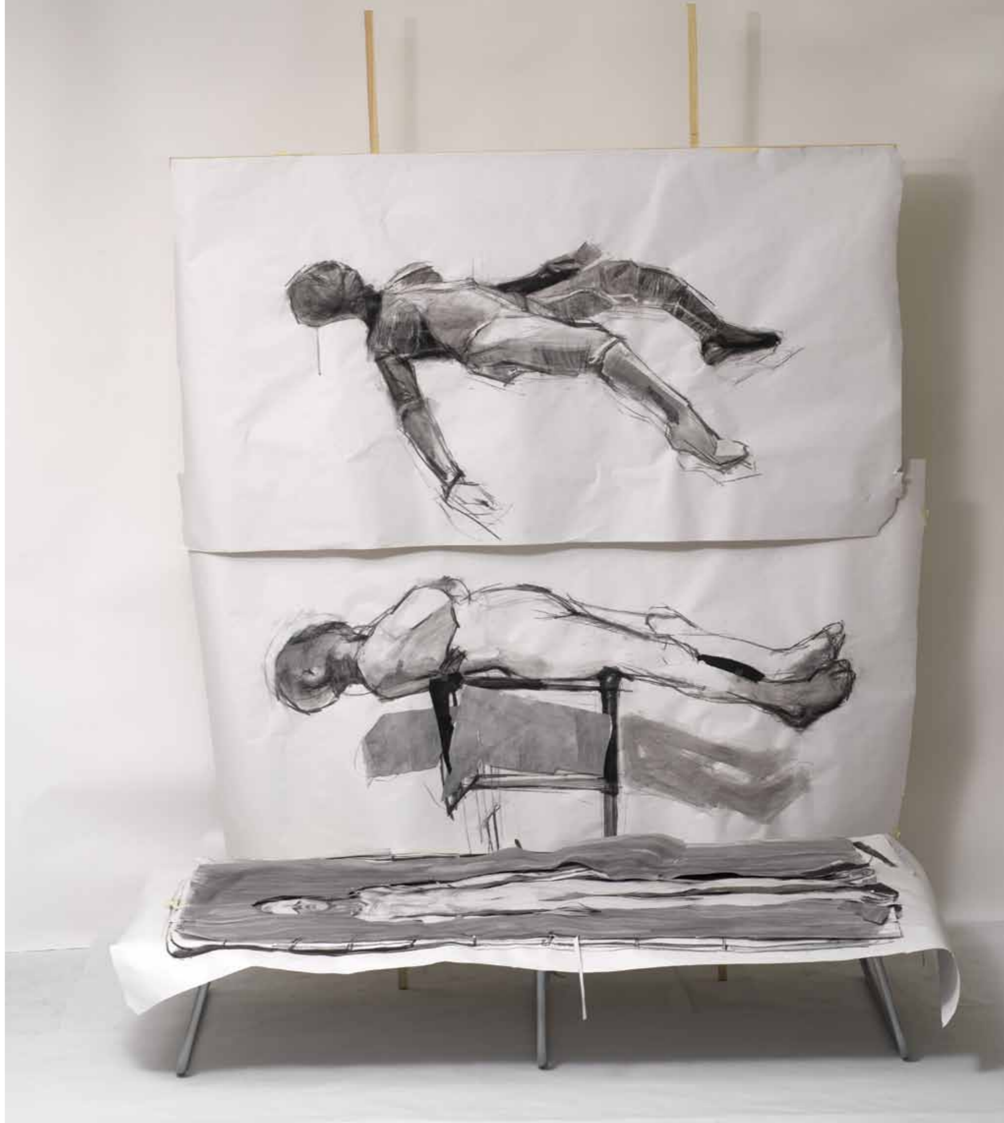
P_ELIV 2011 Κατασκευή, μεικτή τεχνική, χαρτί, ξύλο και μεταλλικό ράντζο, 244 x 205 x 151 εκ 3 σχέδια: 1_100 x 205 εκ, 2_100 x 188 εκ, 3_100 x 183 εκ