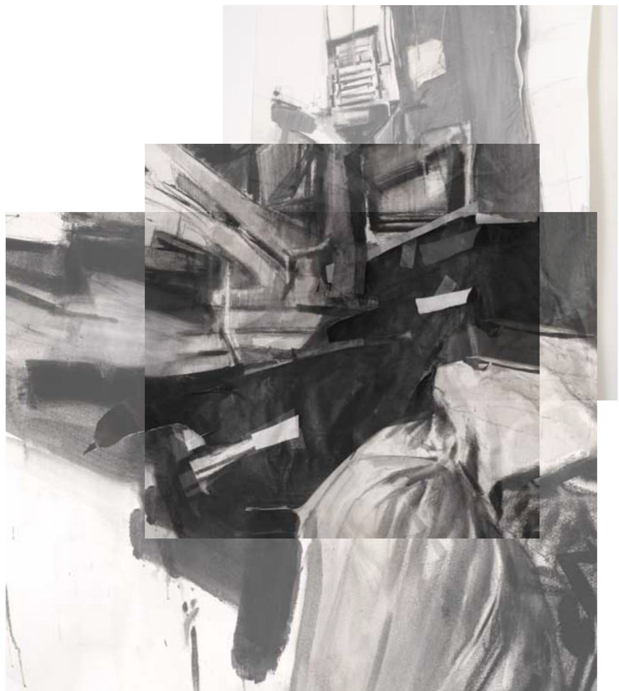
P_B 2011 μεικτή τεχνική σε χαρτί, 167 x 113 εκ