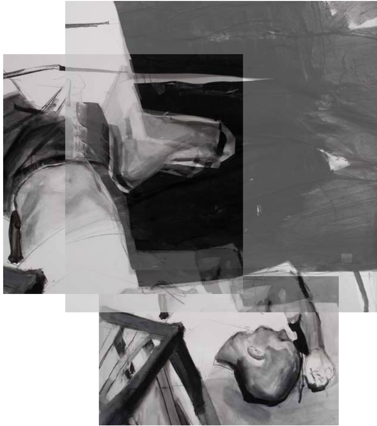
P_K 2011 μεικτή τεχνική σε χαρτί, 225 x 150 εκ