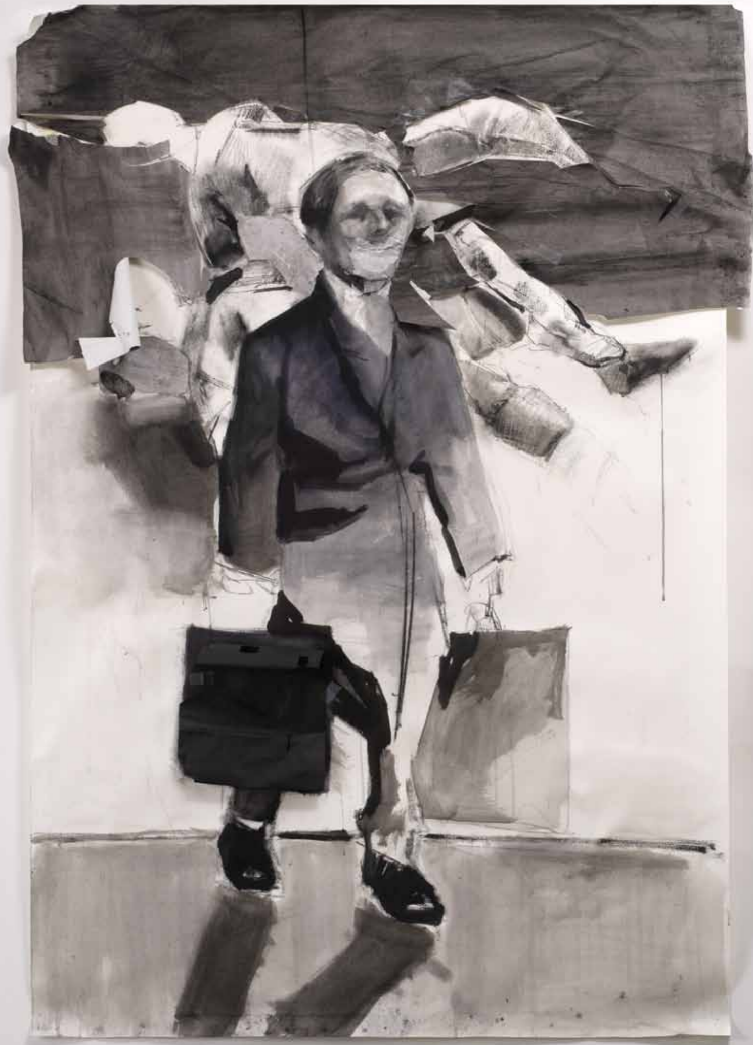
P_TL 2011 μεικτή τεχνική σε χαρτί, 167 x 113 εκ