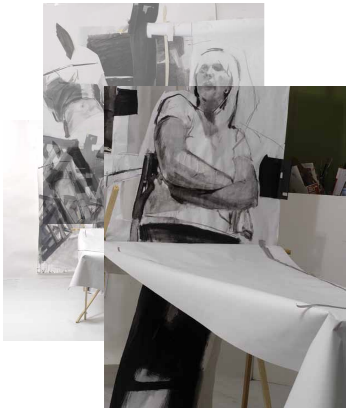
P_K 2011 Κατασκευή, μεικτή τεχνική σε χαρτί και ξύλο, 230 x 148 x 285 εκ.