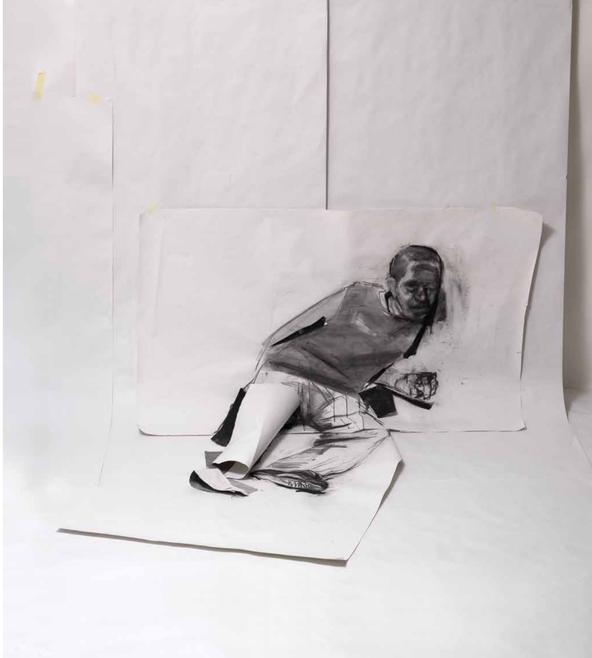
P_J 2011 μεικτή τεχνική σε χαρτί 2 σχέδια: 1_ 100 x 165 εκ, 2_ 134 x 100 εκ