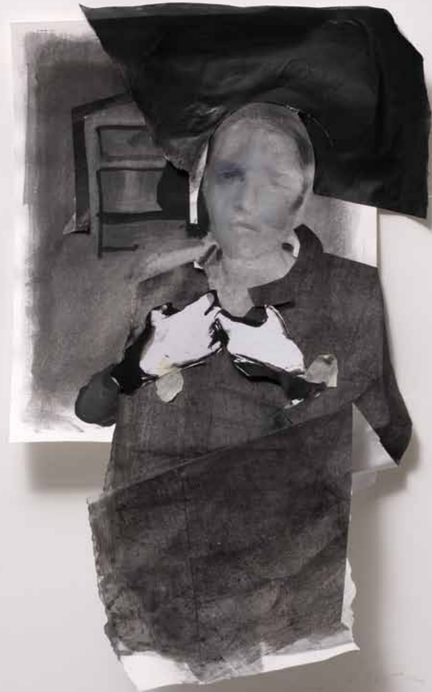
P_HD 2011 μεικτή τεχνική σε χαρτί, κολάζ, 52 x 29 εκ