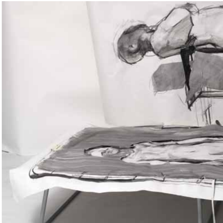
P_ELV 2011 1_100 x 205 εκ