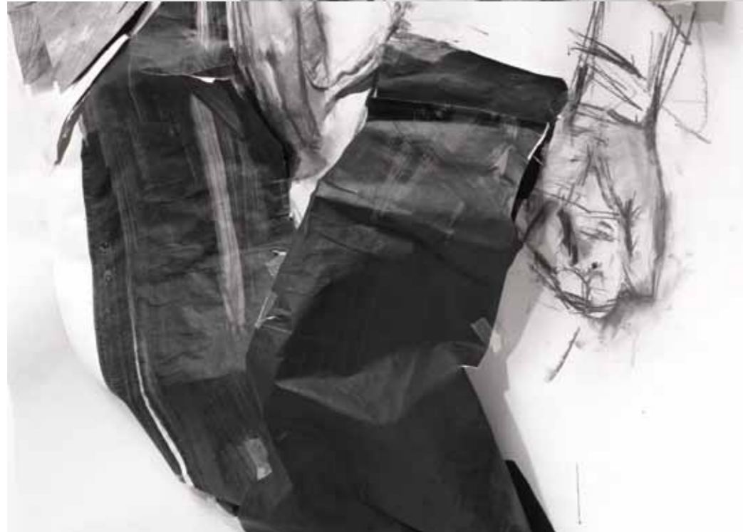
P_ANGL 2011 μεικτή τεχνική σε χαρτί, 208 x 115 εκ