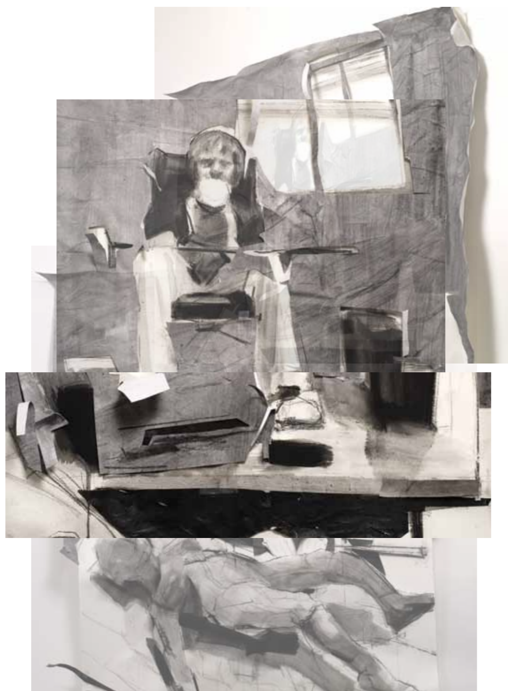
P_XK 2011 μεικτή τεχνική σε χαρτί, 167 x 113 εκ