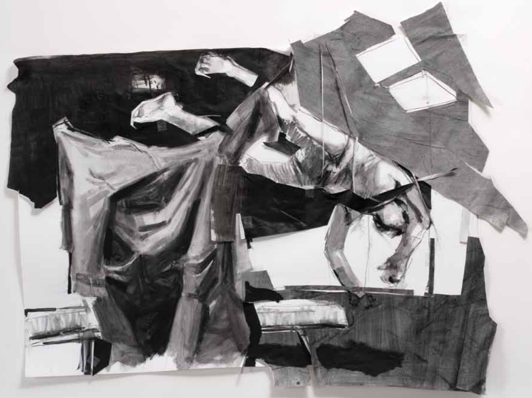
P_ST 2011 μεικτή τεχνική σε χαρτί, 85 x 113 εκ