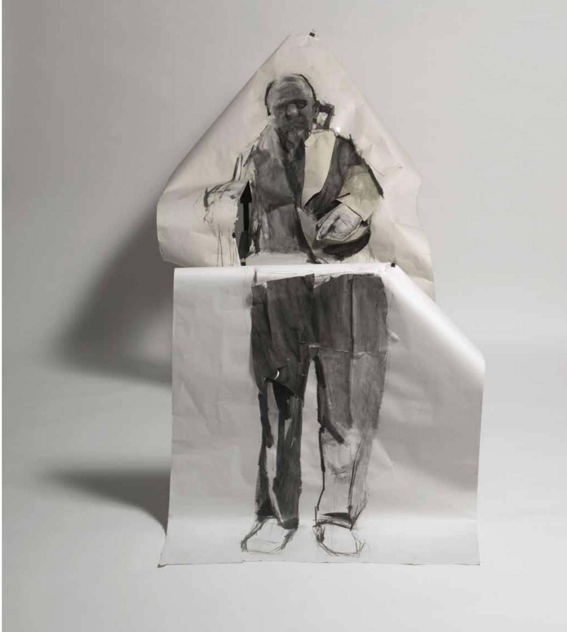
P_CHS 2011 Κατασκευή, μεικτή τεχνική, χαρτί, μεταλλικές καρέκλες, 112 x 100 x 200 εκ 2 σχέδια: 1_112 x 100 x 80 εκ, 2_84 x 100 x 55 εκ