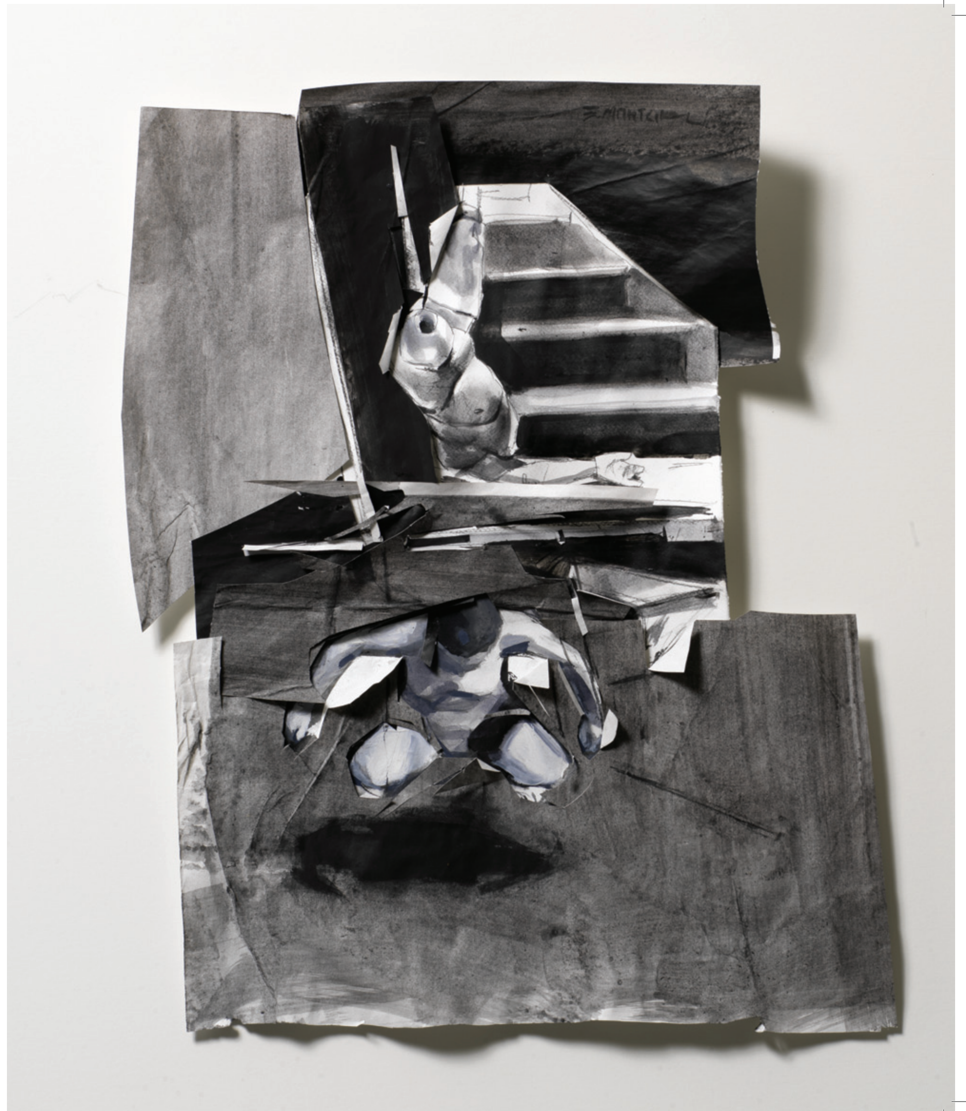
L_HB 2012, μεικτή τεχνική σε χαρτί, 61x48x4 εκ.