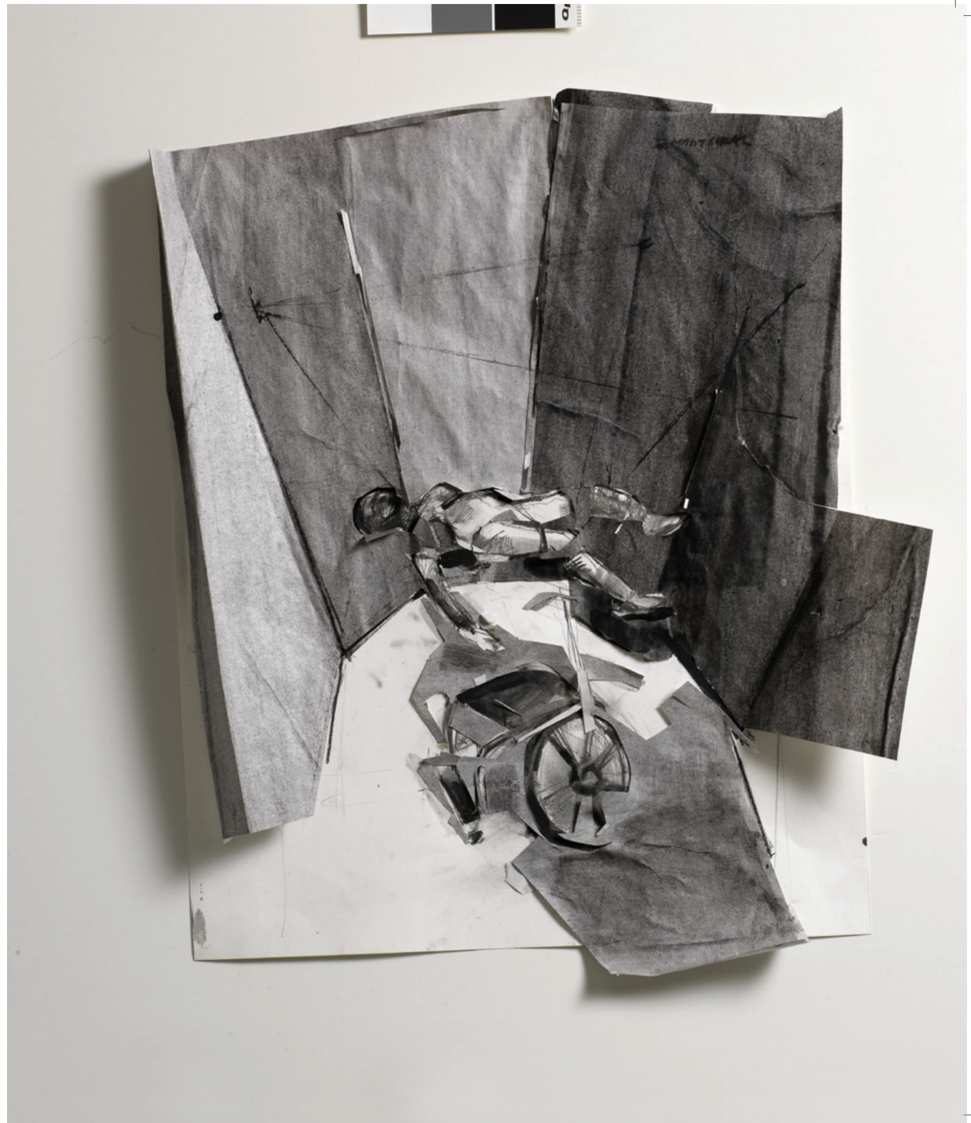
L_WCh1 2012, μεικτή τεχνική σε χαρτί, 59x50x3 εκ.