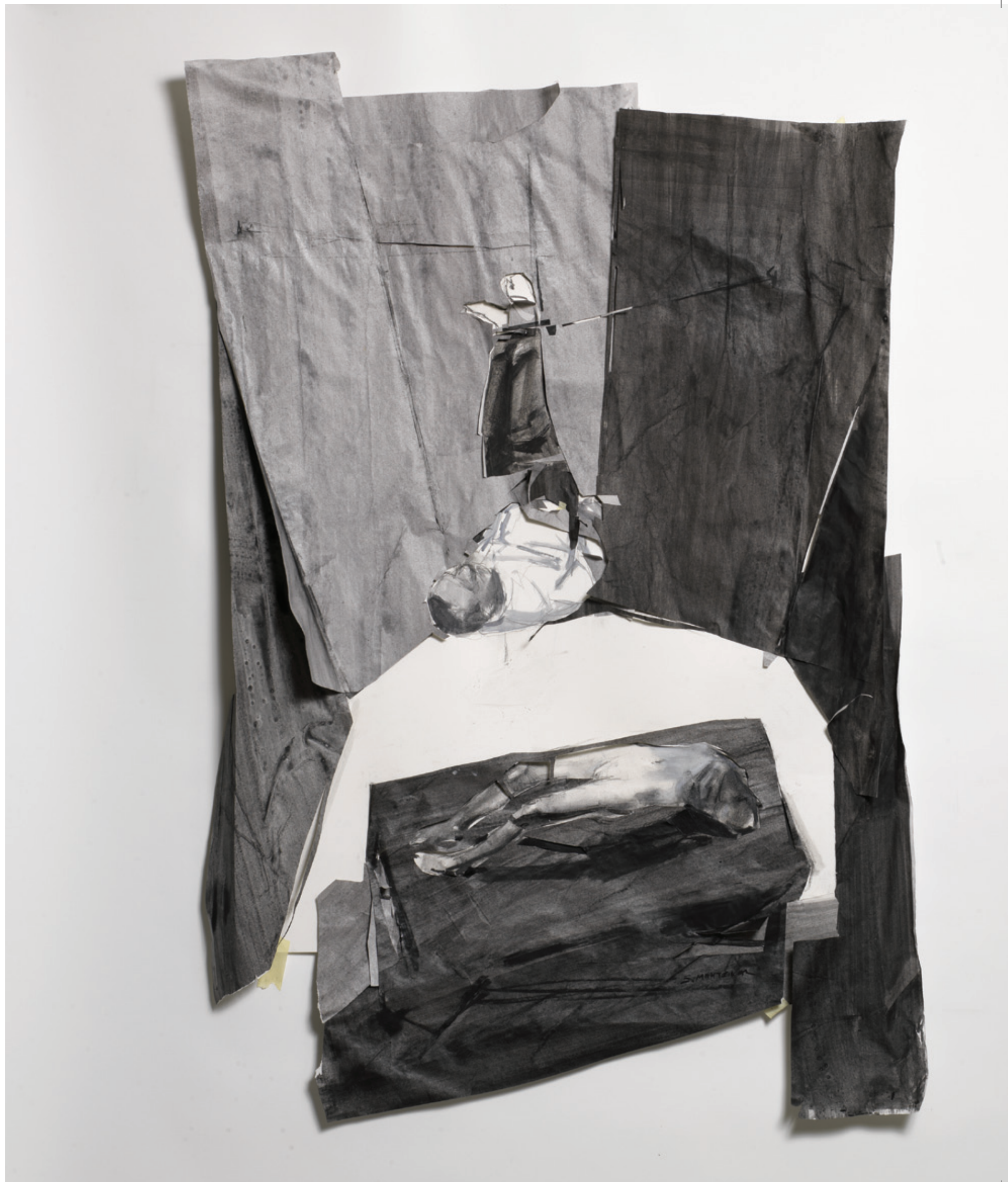
L_HuGE 2012, μεικτή τεχνική σε χαρτί, 130x90x12 εκ.