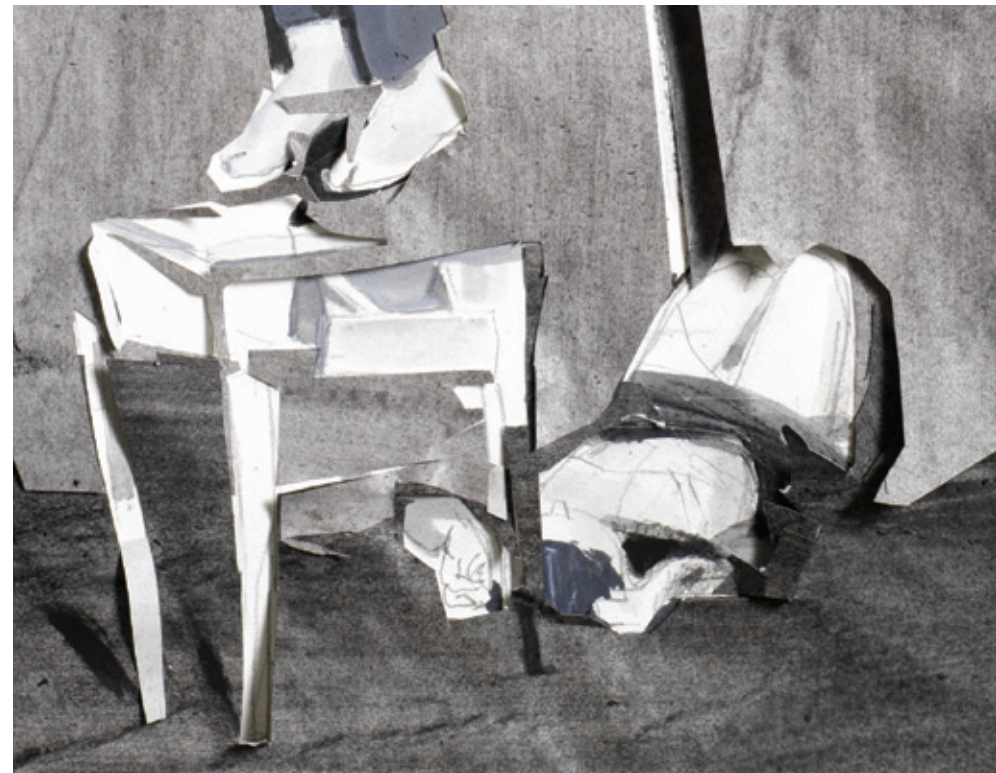
L_TK 2012, μεικτή τεχνική σε χαρτί, 70x58x4 εκ.