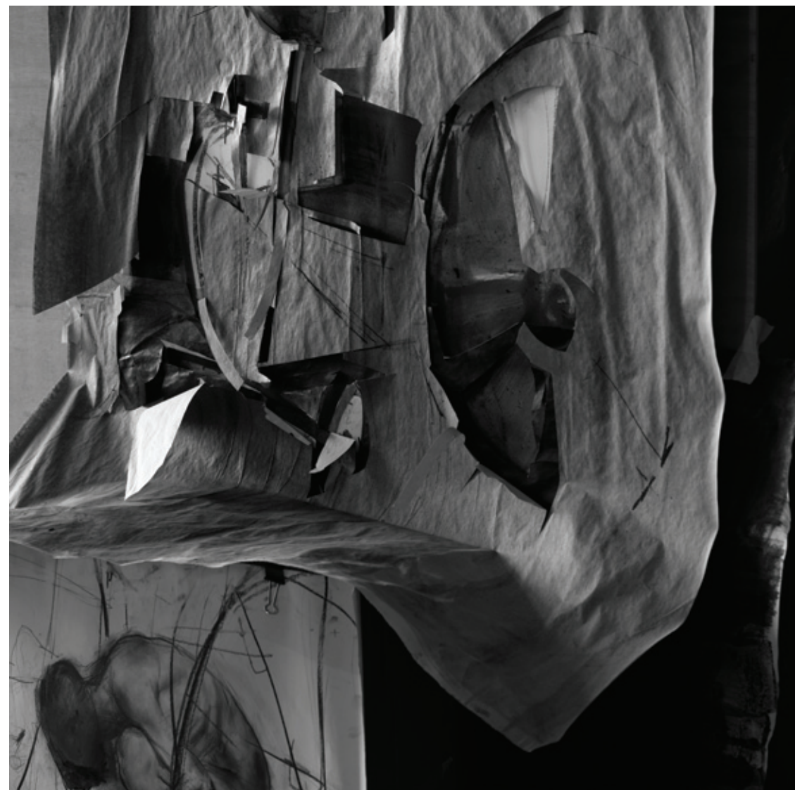
L_WCh2 2012, μεικτή τεχνική, 163x107x35 εκ. L_WCh2-1 2012, μεικτή τεχνική σε χαρτί, 145x107x12 εκ. L_WCh2-2 2012, γραφίτης, κάρβουνο σε χαρτί, 50x70 εκ.