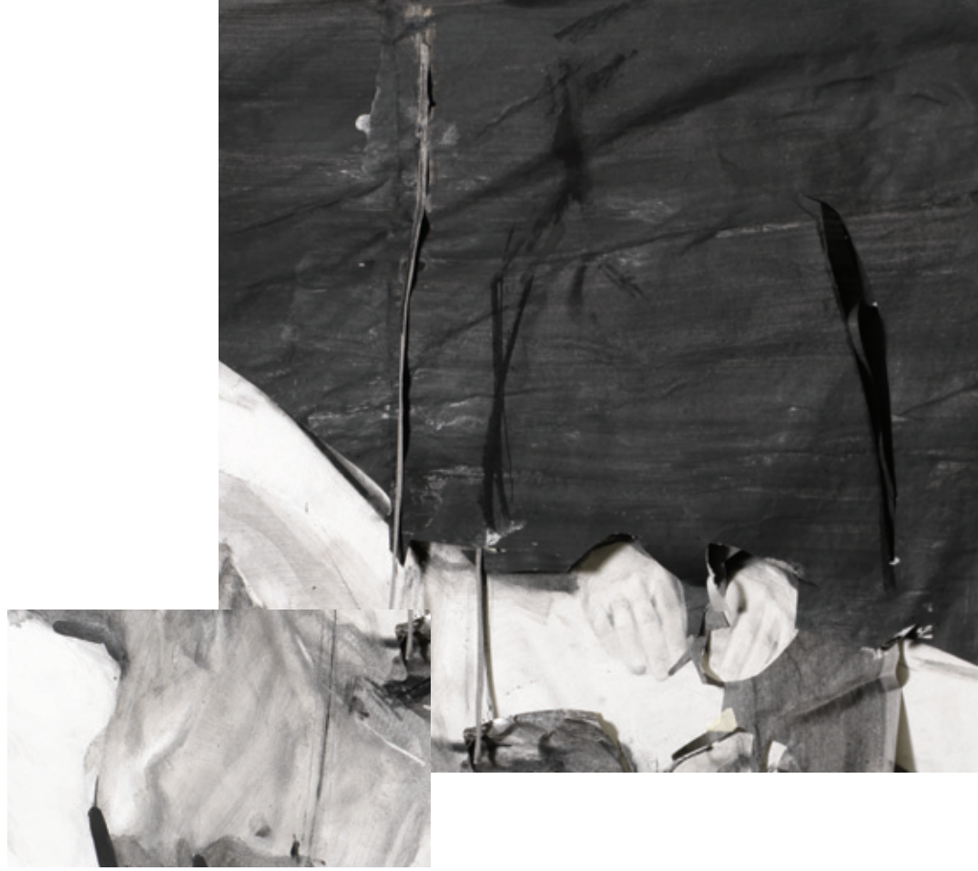
L_NK 2012, μεικτή τεχνική σε χαρτί, 100x130x6 εκ.